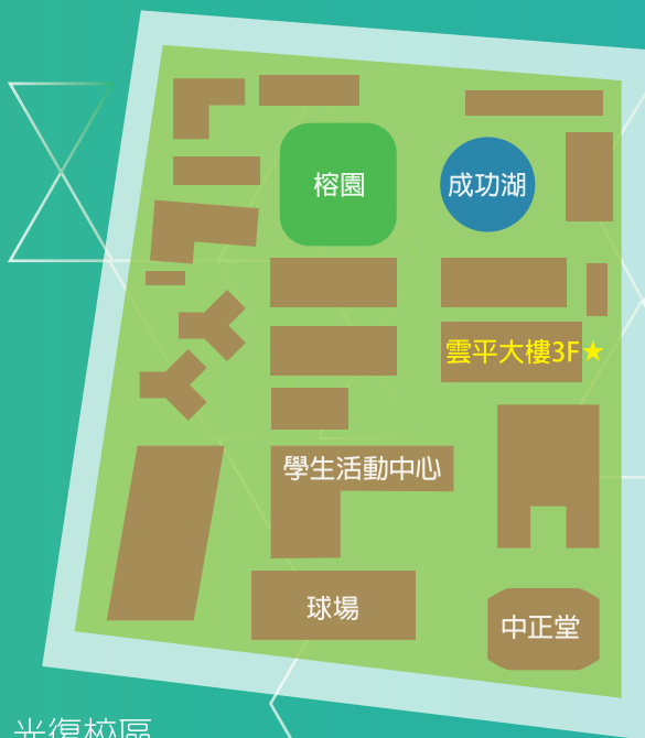
光復校區 Kuang-Fu Campus